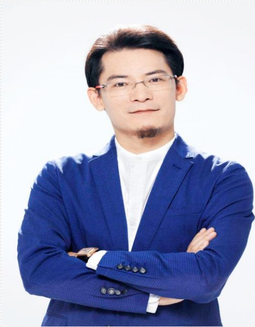
钛铂新媒体董事长CEO