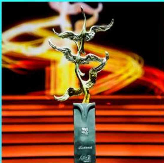
2018 十大经济年度人物评选