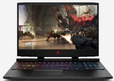
- 暗影精灵5 GTX1050 -