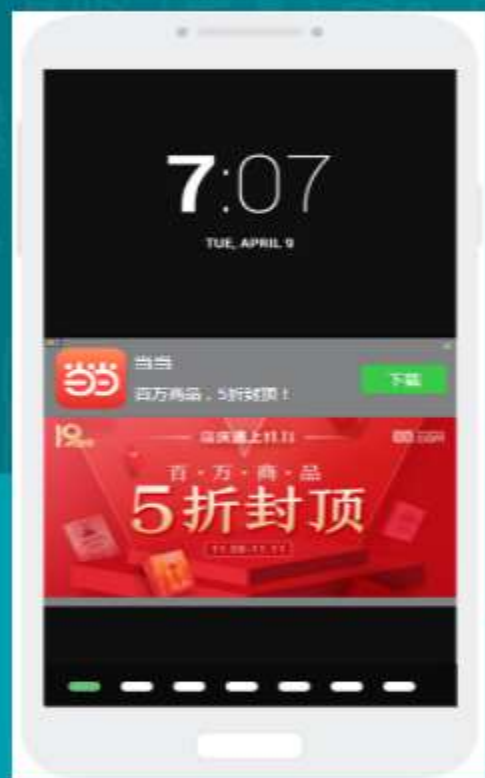
360手机助手充电屏保