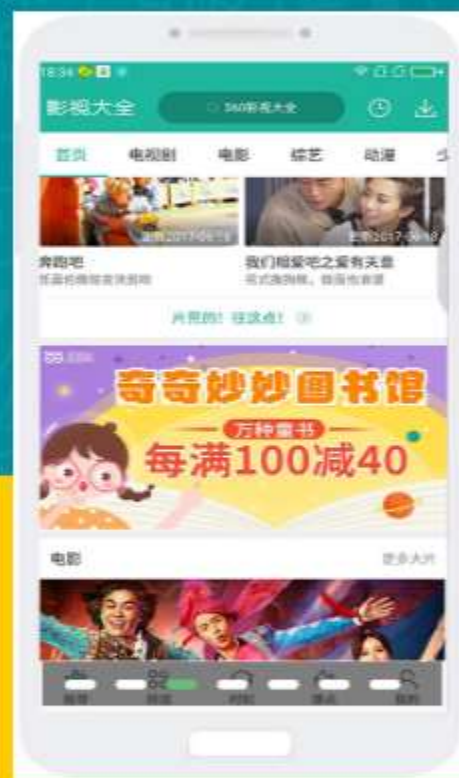
360影视大全搜索页大图