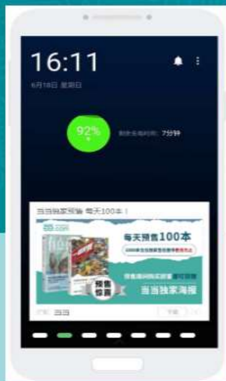
360手机助清理完成页