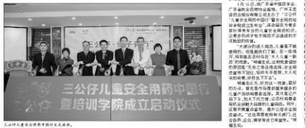
三公仔儿童安全用药中国行 暨培训学院成立启动仪式

【广州讯】为普及儿童安全用药知识，提高家长的安全意识，广药集团三公仔近日在全国范围内开展了“儿童安全用药中国行”活动。活动以“三公仔”品牌为依托，通过举办讲座、发放手册、现场咨询等形式，向广大家长普及了儿童用药的注意事项和误区。广药集团表示，作为一家有责任心的企业，始终将消费者的健康放在首位，致力于为消费者提供安全、有效、优质的产品和服务。此次活动得到了社会各界的广泛支持，取得了良好的社会反响。