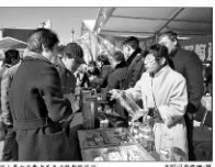
深圳某文化公司涉嫌 虚构宣传及传销

【深圳讯】近日，广东省市场监督管理局接到举报，称深圳某文化公司涉嫌虚构宣传及传销活动。经初步调查，该公司在宣传中夸大其词，诱导消费者参与所谓的“创业项目”，并收取高额费用。监管部门已介入调查，并对该公司采取了强制措施。目前，案件正在进一步审理中。监管部门提醒广大消费者，在参与任何商业活动时要保持警惕，切勿轻信夸大宣传和口头承诺，以免上当受骗。