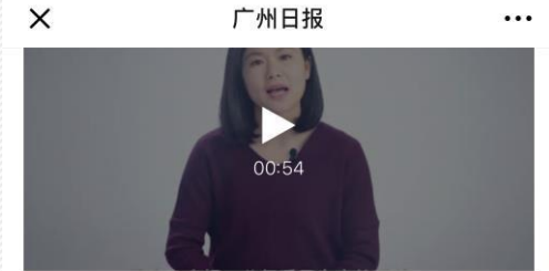
创下世界纪录，三公仔做了什么？

在王老吉药业三公仔的倡议下，为儿童制药领域提供更多支持，正在成为社会共识。在鼓励儿童用药研发之外，如何建立行之有效的激励机制，正在成为公共讨论的议题。成立全国儿童药品不良反应监测中心、大力度减缓儿童用药研发的临床试验难度……一个个行业利好、健康福音，也在众人期待中渐渐迈入现实。