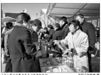
广东省发布百日行政执法典型案例