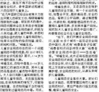
探索儿童用药安全新模式

【北京讯】为探索儿童用药安全新模式，北京市市场监管局近日开展了“探索儿童用药安全新模式”主题活动。活动旨在通过加强药品监管，规范市场秩序，保障消费者权益。市场监管局组织执法人员深入辖区各大药店、医院等场所，开展专项检查，重点查处假冒伪劣药品、价格欺诈等违法行为。同时，还通过举办药品安全讲座、发放手册等方式，提高消费者的药品安全意识和自我保护能力。此次活动的开展，得到了广大消费者的积极响应和好评。