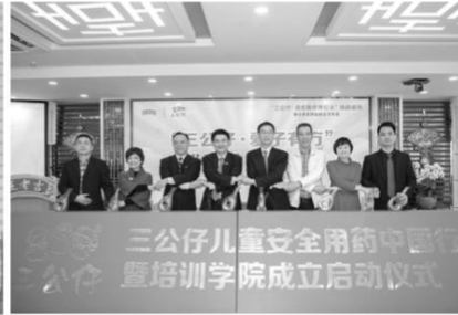
“三公仔儿童安全用药中国行”活动正式启动

内行”生产儿童用药的企业仅占0.1%。另据了解，根据药审评的有关法规，同一种药要生产小剂型，需经国家药监局审批，提供研发数据证明确实适用于儿童。而目前国内3500多个药品剂型中，供儿童专用剂型仅60种(含中成药)，98%药品没有儿童剂型。